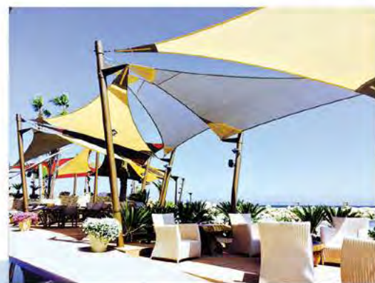
Amathus Limanaki Tavern

Είναι η ιδανική λύση για σκιάστρα αυτοκινήτων, σκαφών, αθλητικών χώρων και εκπαιδευτικών ιδρυμάτων, πισίνων, εξωτερικών χώρων εστίασης και αναψυχής