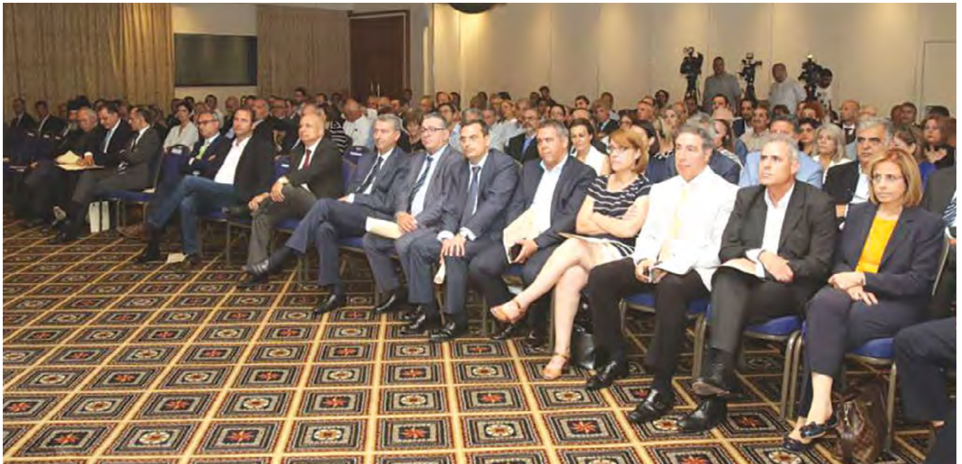
Τη Γενική Συνέλευση του ΠΑΣΥΧΕ τίμησαν με την παρουσία τους υπουργοί, αρχηγοί ή εκπρόσωποι κομμάτων, βουλευτές, μέλη του διπλωματικού σώματος, πρέσβεις ξένων χωρών και παράγοντες από όλο το φάσμα της οικονομικής δραστηριότητας του τόπου.