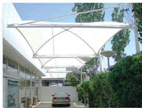
Carports - BMW Pilakoutas