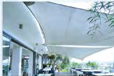
Santa Marina Retreat