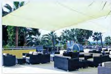
St. George Hotel