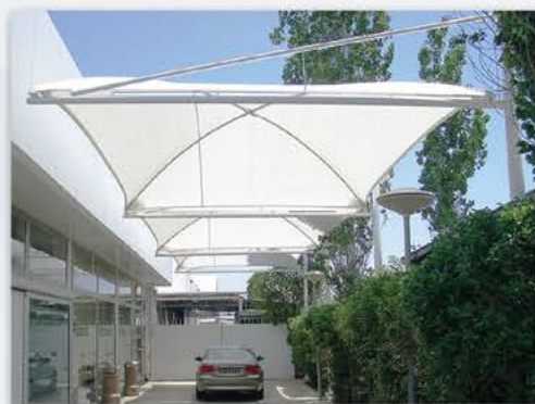
Carports - BMW Pilakoutas