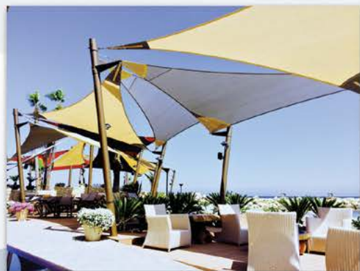
Amathus Limanaki Tavern

Είναι η ιδανική λύση για σκιάστρα αυτοκινήτων, σκαφών, αθλητικών χώρων και εκπαιδευτικών ιδρυμάτων, πισίνων, εξωτερικών χώρων εστίασης και αναψυχής