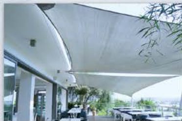
Santa Marina Retreat