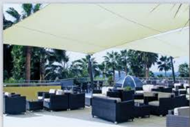
St. George Hotel