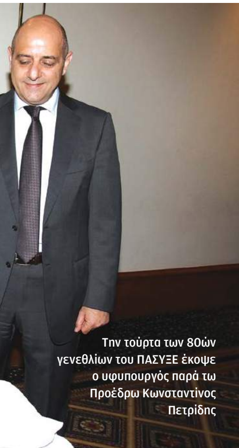
Την τούρτα των 80ών γενεθλίων του ΠΑΣΥΞΕ έκοψε ο υφυπουργός παρά τω Προέδρω Κωνσταντίνος Πετρίδης