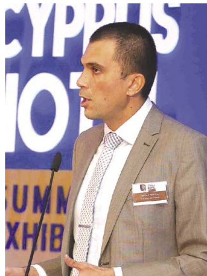
Ο υφυπουργός Τουρισμού.