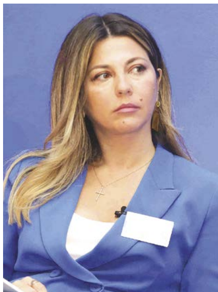
Η κ. Σοφία Ζαχαράκη, υφυπουργός Τουρισμού της Ελλάδας.