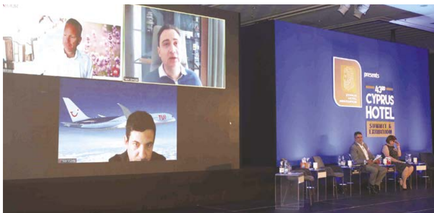
Συζήτηση Στρογγυλής Τραπέζης με εκπροσώπους διοργανωτών ταξιδιών.

επισκέπτες. Μάλιστα, ανακοίνωσε ότι η εταιρεία του προτίθεται να προβεί σε επενδύσεις στον ξενοδοχειακό τομέα στην Κύπρο. Ιδιαίτερα σημαντική ήταν και η εξαγγελία από τον κ. Ivor Vucelic, Director of Hotel Product and Purchasing East Of The World, της TUI GROUP Γερμανίας, ο οποίος ανακοίνωσε πως ο