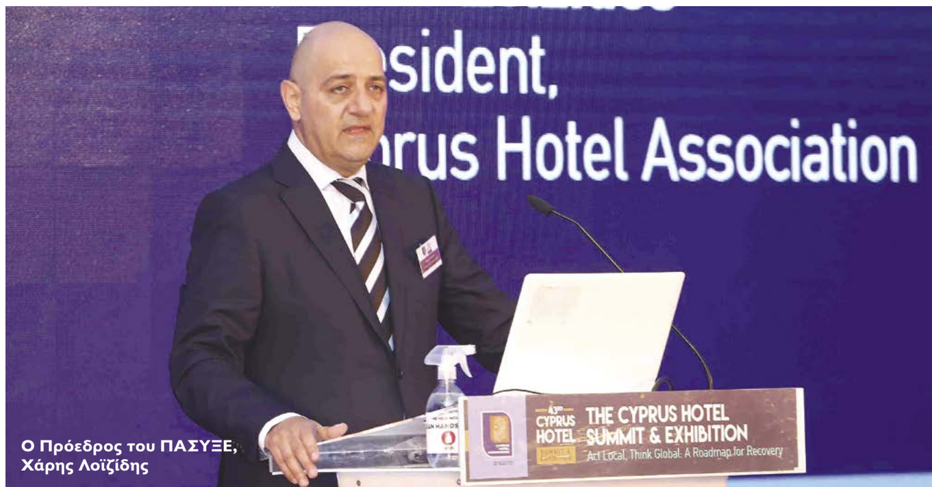
Ο Πρόεδρος του ΠΑΣΥΞΕ, Χάρης Λοιζίδης