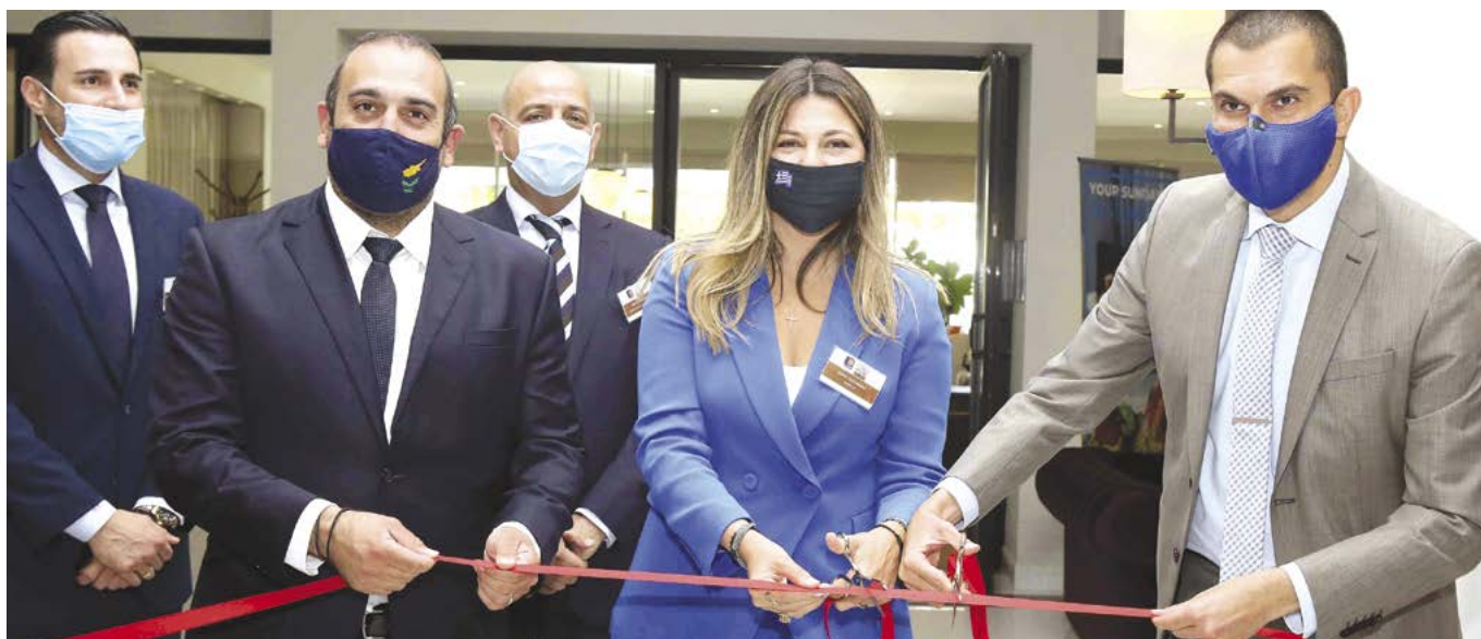
Τα εγκαίνια της Έκθεσης από τον υπουργό Μεταφορών της Κύπρου και τους υφυπουργούς Τουρισμού της Ελλάδας και της Κύπρου.