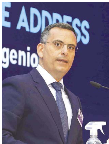
Ομιλία του CEO της PwC Cyprus.