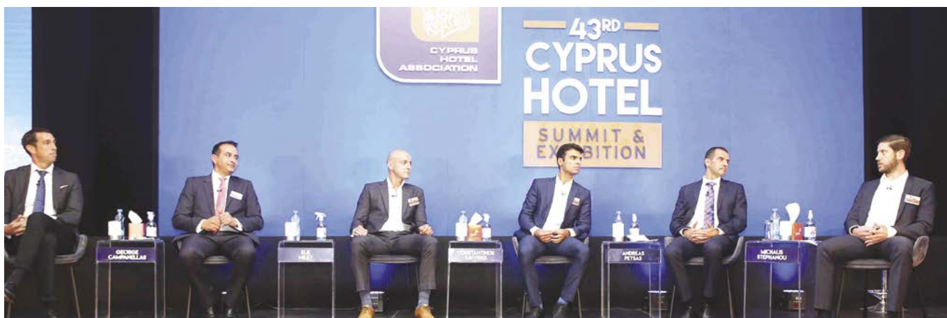
Συζήτηση Foreign Direct Investment in the Cyprus Hotel Sector.