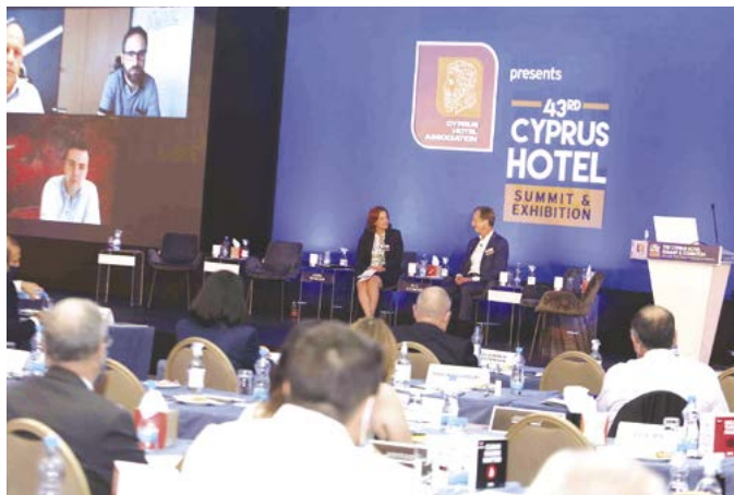
Συζήτηση μεταξύ εκπροσώπων αεροπορικών εταιρειών.