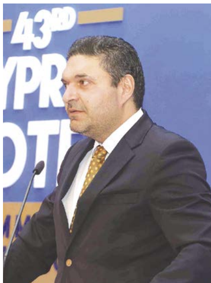
Ο υπουργός Οικονομικών.