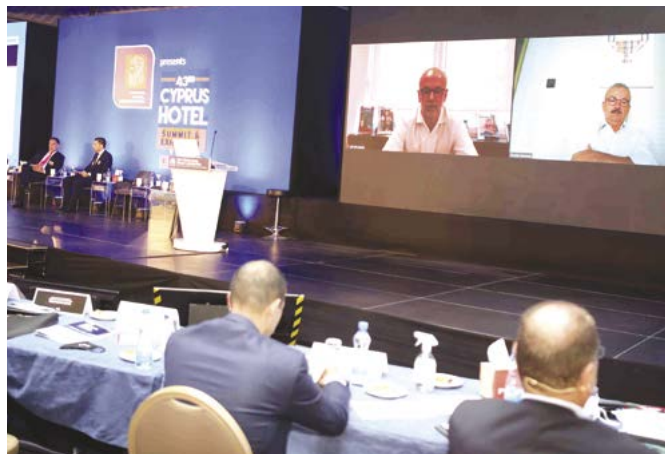
Συζήτηση ξενοδόχων, στο πλαίσιο του Συνεδρίου.