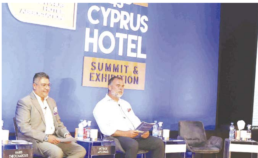
Συζήτηση με θέμα το Online Booking.