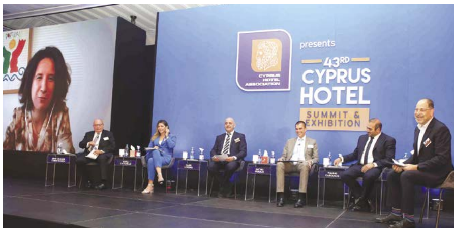
Συζήτηση Στρογγυλής Τραπέζης Υπουργών της ΕΕ. Στην οθόνη η κ. Rita Marques, υπουργός Τουρισμού της Πορτογαλίας.

Στο περιθώριο του συνεδρίου του ΠΑΣΥΞΕ πραγματοποιήθηκε η «Έκθεση Προϊόντων και Υπηρεσιών» με τη συμμετοχή πέραν των 30 μεγάλων επιχειρήσεων που δραστηριοποιούνται στον τομέα. Το 43ο Ξενοδοχειακό Συνέδριο και η Έκθεση Προϊόντων και Υπηρεσιών που οργάνωσε ο ΠΑΣΥΞΕ πραγματοποιήθηκαν υπό την αιγίδα του Υφυπουργείου Τουρισμού. Κύριος Χορηγός Οίκος PWC CYPRUS, Αργυρός Χορηγός SWISSPORT, Χορηγοί CITY OF DREAMS